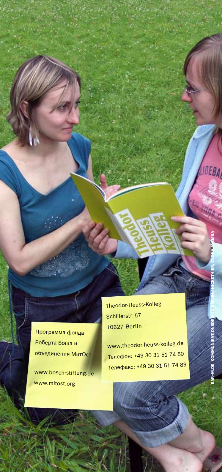
BAR-MI.DE KOMMUNIKATIONSDEIGH BERLIN / HICKETHIER, ЕНОКА АЖМБА